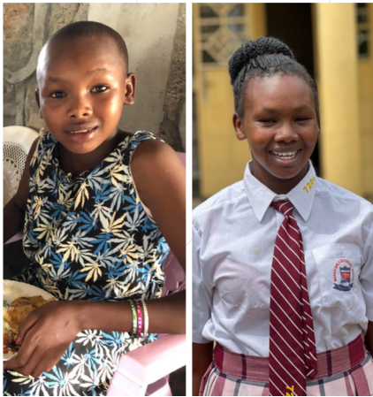
Bilde: dette er blant de første som kom inn!