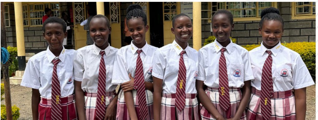
Bilde: blant de første som begynte på videregående.

Ta kontakt om du vil være med i denne viktige tjenesten, så har du også mulighet til å bli med å treffe ditt fadderbarn.